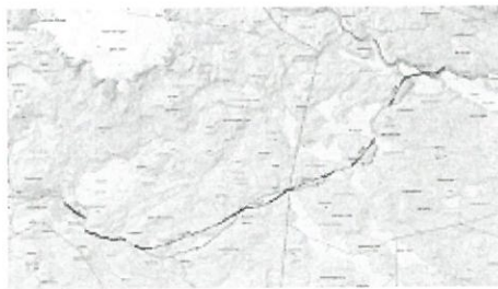
Kart K2 Bilde .jpg 7344K